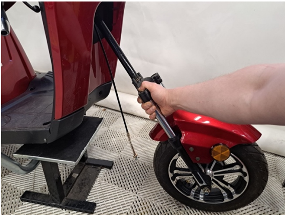
Laske keula alas.