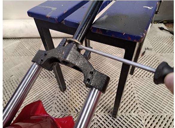
Ota alemman ohjauslaakerin kooli pois.

Uuden osan asennus käänteisessä järjestyksessä.