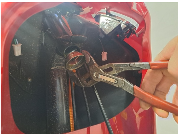
Ota alemman ohjauslaakerin kooli pois.