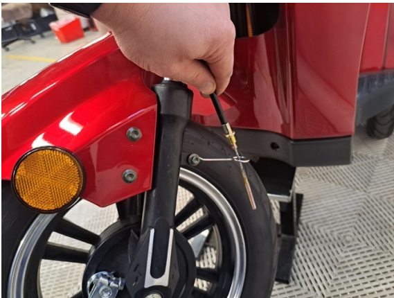
Vedä etujarrun vaijeri pois kannakkeesta.