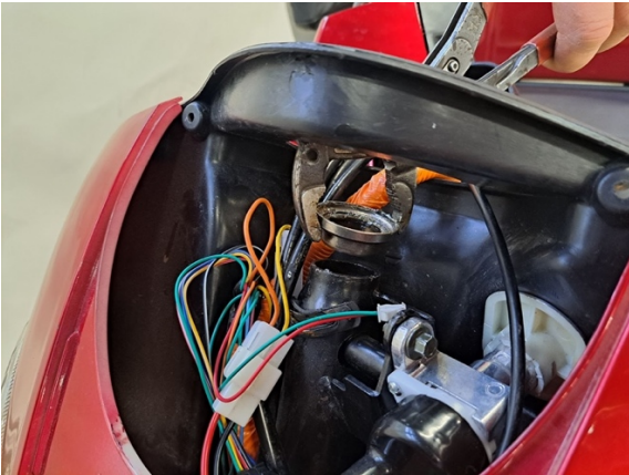
Ota ylemmän ohjauslaakerin kooli pois.