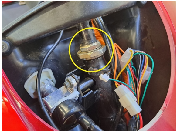
Irrota ohjausakselin kiinnitysmutterit. (kiintoavain 32 mm, 45 mm). Tue keulaa samalla, ettei se pääse putoamaan hallitsemattomasti.