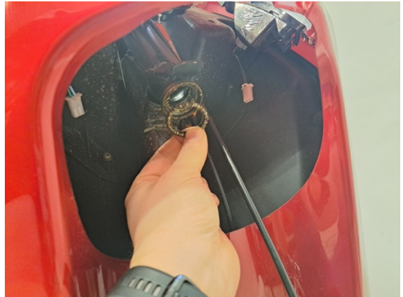
Ota alempi ohjauslaakeri pois.