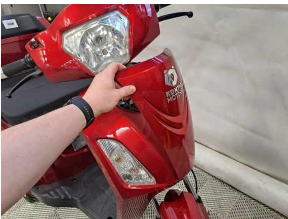
Ota etupaneeli pois.